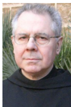
Bernabé Dalmau Monjo de Montserrat

És per això que a la llista de temes importants sobre els quals la Conferència Episcopal Tarraconense ha anat oferint al nostre poble fidel matèria de reflexió, volem afegir ara unes senzilles consideracions sobre la realitat de Catalunya. Les oferim bonament als cristians de les nostres diòcesis en primer lloc, com a punts d'orientació, i a tot al nostre poble com a contribució, des del nostre ministeri episcopal, al bé comú del país. És evident, d'altra banda, que Catalunya entra plenament en la visió que de l'aportació del cristianisme a la cultura europea donava Joan Pau II en la seva al·locució a la UNESCO , pronunciada el 2 de juny de 1980: «No serà certament exagerat d'afirmar en particular que, a través d'una multitud de fets, l'Europa entera —de l'Atlàntic a l'Ural— testimonia, en la història de cada nació així com en la de tota la comunitat el lligam entre la cultura i el cristianisme».